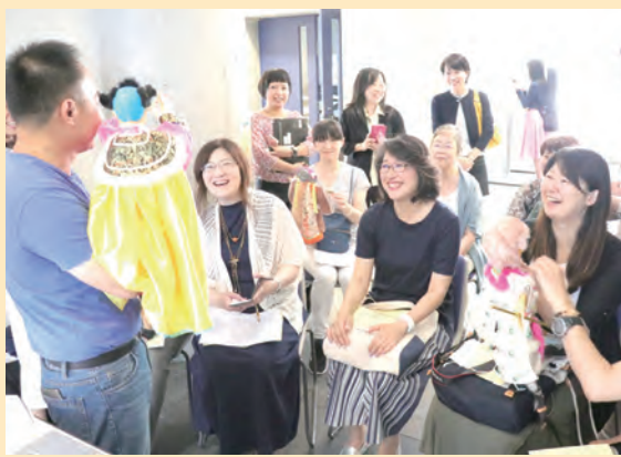
▲文藻外大團隊介紹布袋戲偶，日本觀眾驚艷連連。

文藻外大此行訪日的文化交流成果豐碩，團隊成員數日來均親自背負大型電視木偶，穿梭於東京、大阪街頭，並於景點處取偶展示、與日本市民同樂，完成了一趟台灣布袋戲的「日本快閃之旅」。