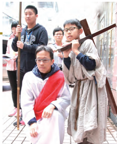
▲父子同心，體驗苦路。

參加「家庭信仰生活日」唯一顧慮的，是時間問題，因為1個月只有4個周日，小朋友也有其他的活動，譬如說小朋友每月有一次圍棋比賽等，就很擔心會有衝突。但這個活動我們也想嘗試，因為我們是剛領洗的新教友，還沒有建立甚麼家庭祈禱模式，還在摸索中，所以就來體驗看看。