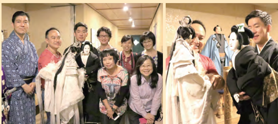
▲文藻外大團隊前往日本行銷台灣布袋戲，與日本文樂專業人士交流。