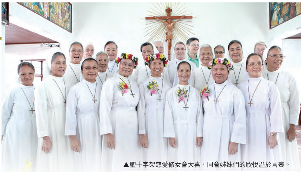
▲聖十字架慈愛修女會大喜，同會姊妹們的欣悅溢於言表。