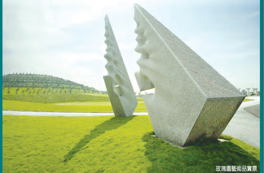
玫瑰園藝術品賞景