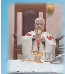
狄剛總主教演講 (MOD學習與成長)

☆若已有MOD（尚未登記為天主教友），請註明用戶姓名、用戶號碼、營運處代號、手機及地址，傳真天主教之聲傳播協會02-2394-8690，或來電02-2397-4701，電郵cath.voice@msa.hinet.net。謝謝您。