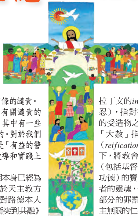
◀全球慶祝馬丁路德宗教改革500周年紀念開幕活動禮儀中使用的十字架

1517年10月31日，路德在威登堡聖多默教堂（城堡教堂）大門上張貼《九十五條論綱》（Ninety-five Theses），題名為《駁斥有關大赦的效能》（Disputation on the Efficacy and Power of Indulgences）。何謂「大赦」？Indulgence這個字源自