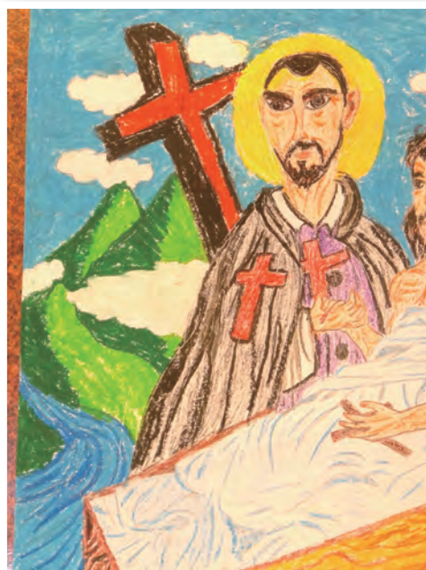
▲維洛納所優選的作品聖家堂—吳彥愷