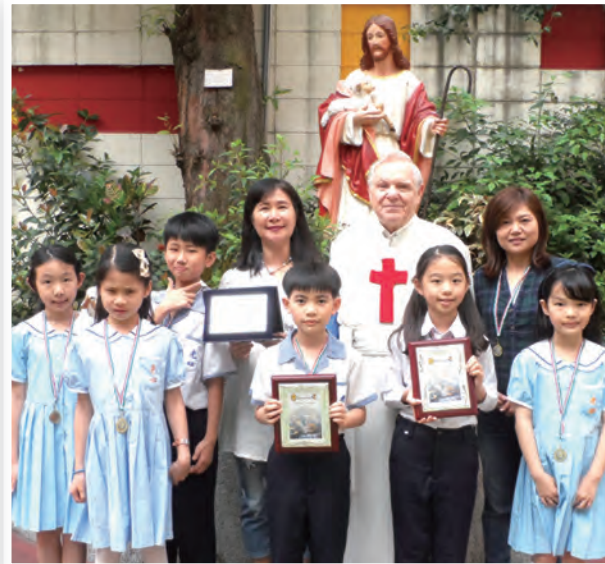
▲台北光仁全體參賽學童在耶穌善牧像前合影。 ▲台中育仁全體參賽學童在校園內歡喜合影。