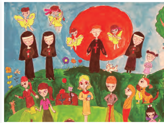
▲維洛納所優選的作品光仁—于語嫻