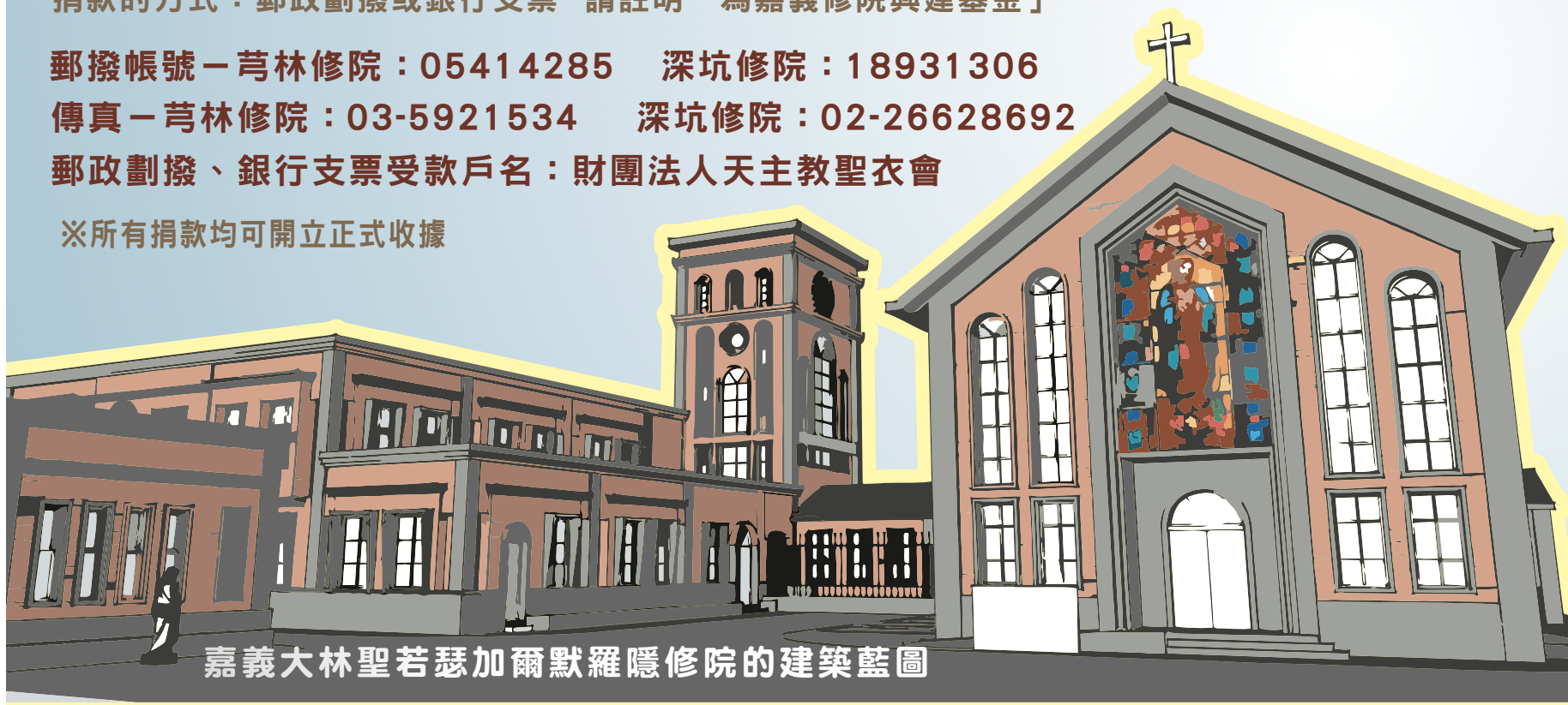
嘉義大林聖若瑟加爾默羅隱修院的建築藍圖