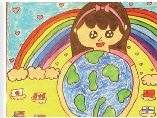
▲維洛納所優選的作品台北道明—Wu.Lydia