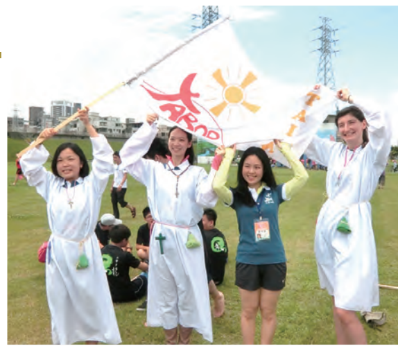
◀大博爾對不隊，加油！