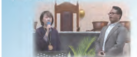
祈禱音樂會 (MOD學習與成長)