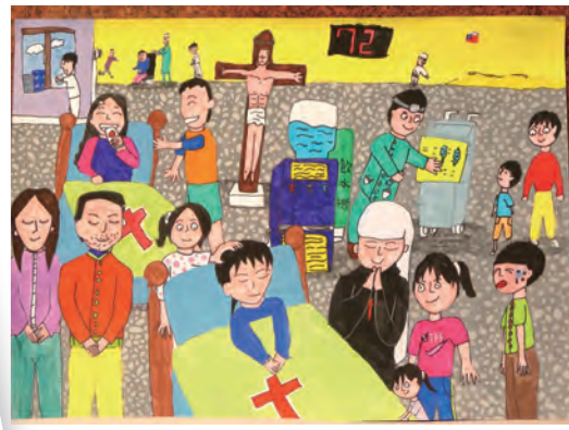
▲維洛納所優選的作品台北光仁—楊禾安